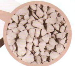
ニチノーストーン原物