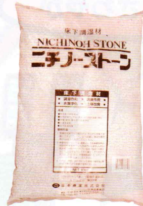
ニチノーストーン (10kg/袋)

※床下湿気対策は床下換気扇との併用で万全となります。※防湿対策に加えて防蟻工事をすれば、床下対策は完璧です。