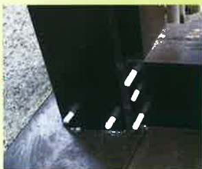
②モクボープラグを挿入する。