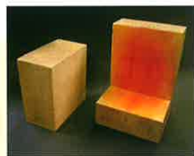
■赤色がプラグ浸潤部