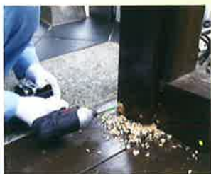
①直径9mm×長さ80mm の穴をあける。