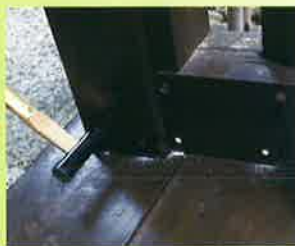
③ハンマーで打設する。